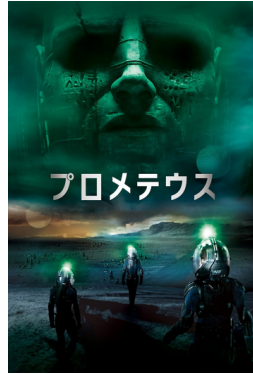
リドリー・スコット監督による 2012年公開のSF映画 「エイリアン」の原点